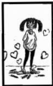
Ilustración de cubierta: TONY ROSS